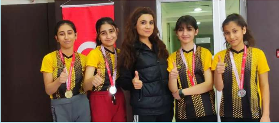
BATMAN FLOOR CURLİNG YILDIZ KIZLAR İL 3.LİŐİ