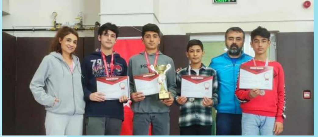
BATMAN FLOOR CURLİNG YILDIZ ERKEKLER İL 2.LİŐİ