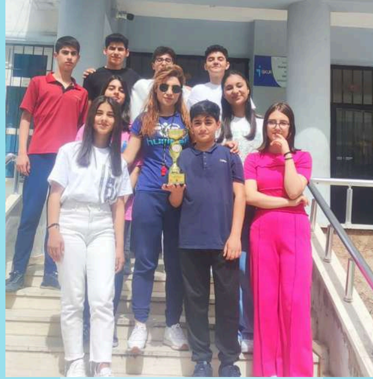
Korfbol il üçüncülüğü