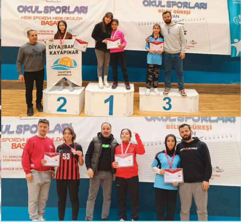
Bilek Güreşi Bölge 3. lüğü